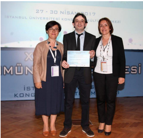
Primer İmmün Yetersizlik Ödülü